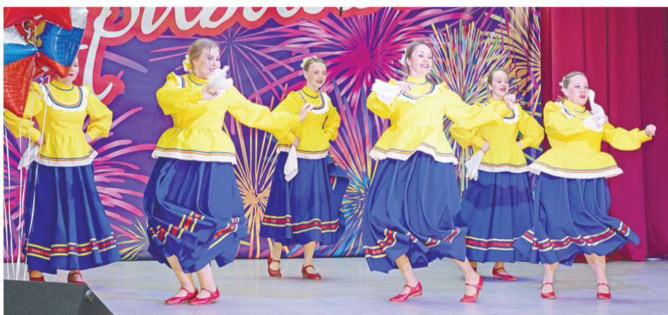
В ЦДК всех желающих ждал праздничный концерт.