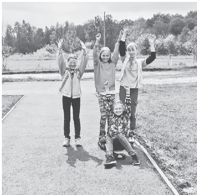
Первый и пока единственный кусочек твёрдого покрытия в Сафоновой.

На днях бригада АО «Мелиострой» сделала на площадке асфальти-