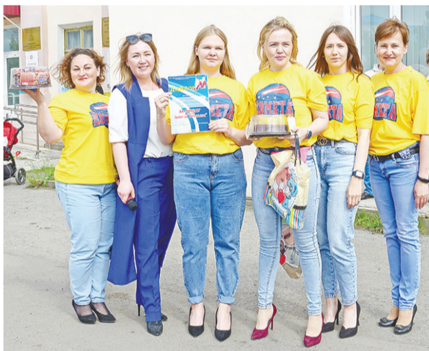
Победу в квесте одержала «Комета на шпильках».