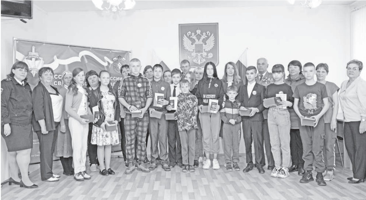
Вручение паспортов юным гражданам было приурочено к Дню России.