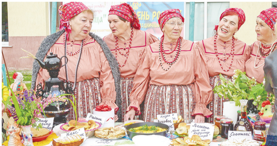
Лучший торговый ряд представил хор ветеранов.

В этом году на 12 июня пришлось сразу два праздника: молодой, но уже полюбившийся россиянам – День России и отмечаемый с незапамятных времён – Троица. В этот день во многих населённых пунктах прошли праздничные мероприятия. Основные торжества по традиции состоялись на центральной площади Байкалово.